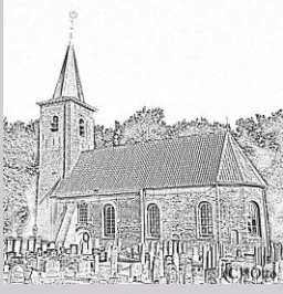
Romaanse Kerk Marum