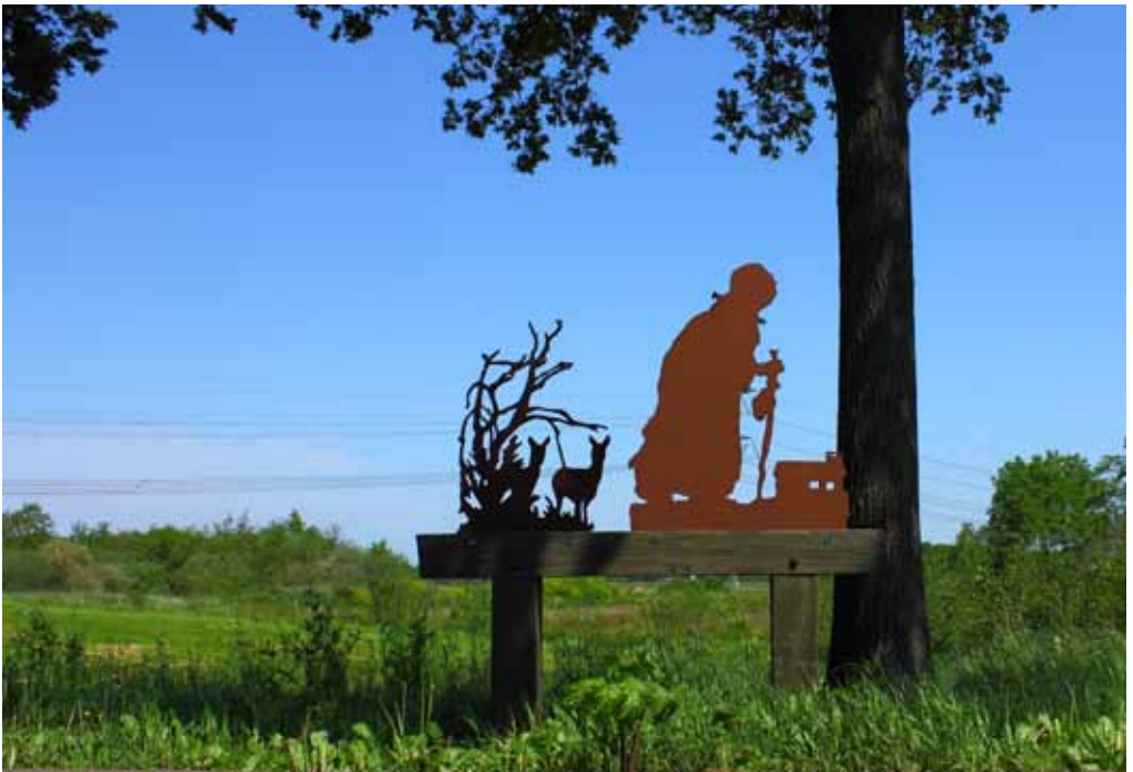
Kunstwerk Vrouw Snakenborg aan de Hooiweg. Gemaakt door Jeb64 uit Lucaswolde