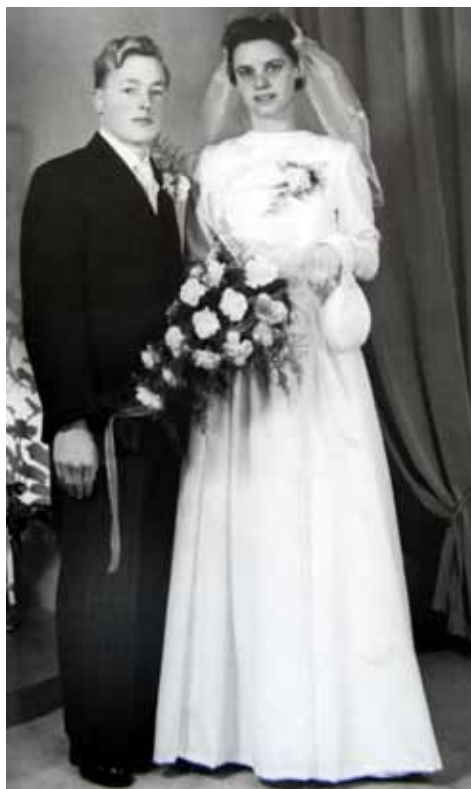
Trouwfoto van het jonge stel. Getrouwd 14 november 1958.