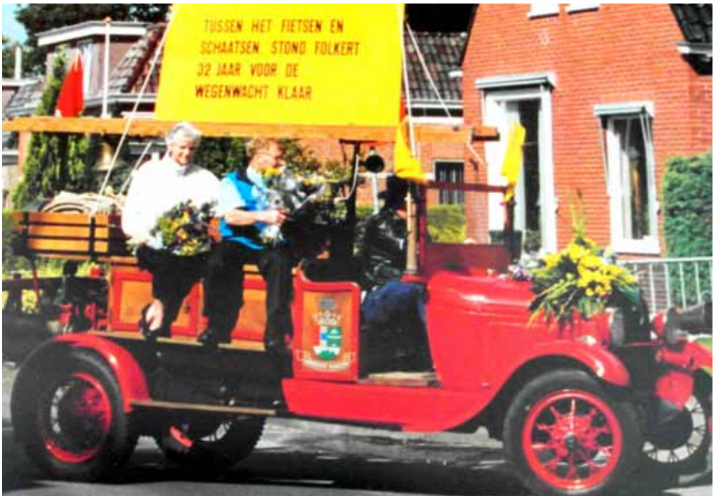
Afscheid van de wegwacht in 1993 en wel samen met mijn vrouw zittend op een oude brandweerauto.

We wonen nog tot groot genoegen op het oude vertrouwde plekje aan de Lindsterlaan. Hobby's genoeg. Op dit moment wordt er nog gesport in de club van tien, die al twintig jaar bestaat. Eén keer in de week volleyballen we. Ik voel me, ondanks dat ik al 81 jaar ben, nog vitaal. Ook heb ik in het bestuur van de ijsvereniging aan de Pierswijk (bij de Kruisweg) gezeten, een samenwerking van Marum en Nuis. Verder heb ik in het schoolbestuur en in de kerkenraad als ouderling en diaken gezeten. In de kerk ben ik begonnen in de financiële commissie, de z.g. commissie van beheer. Daarnaast heb ik ook nog deel uitgemaakt van het bestuur van het CDA en ben ik tijdens mijn loopbaan secretaris van de personeelsvereniging van de wegwachten geweest.