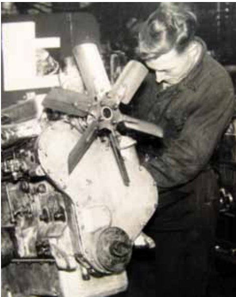
De "aspirant wegwacht" in de revisie-afdeling van de ESA in Marum.

om nieuwe ervaringen in de garage op te doen. Het moest en zou lukken om bij de wegwacht te komen. Een neef van mijn schoonzuster had een garage in Waskemeer. Die wilde mij graag als monteur in de garage. Wat schetst mijn verbazing! Ik was er nog maar heel kort, toen ik weer een brief van de ANWB kreeg. De genoemde vijf jaar werden maar vijf maanden. Maar in mijn ogen kon ik het niet maken ten opzichte van mijn nieuw baas in Waskemeer om nu al weer weg te gaan en ik liet dat de ANWB weten. Ik wou ook nog meer ervaring op doen. Een aantal maanden later, in augustus 1961, kreeg ik weer een brief van de ANWB met wederom een uitnodiging voor een gesprek. Ik werd vervolgens getest en werd direct aangenomen. Uiteraard was ik in de wolken en mijn toekomst was grotendeels uitgestippeld. Op 4 december 1961 begon ik met de opleiding, circa anderhalf jaar na de opening van de rijksweg.