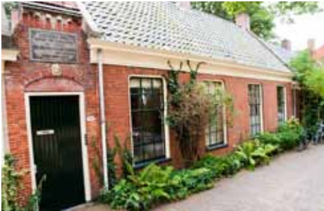
Het Gerarda Anna Pauline Gasthuis in de Rozenstraat, Hortusbuurt

In 1971 werd het gasthuis verkocht aan de Universiteit, die fors wilde uitbreiden in de Hortusbuurt. Na aanpassing van die plannen kon het gasthuis behouden blijven. De huisjes worden tegenwoordig bewoond door particulieren. In 1973 nam de stichting Gerarda Huis deel aan de Stichting Verenigde Groninger Gasthuizen welke speciaal is opgericht voor de bouw en het beheer van 108 appartementen. Het archief is in bewaring gegeven.