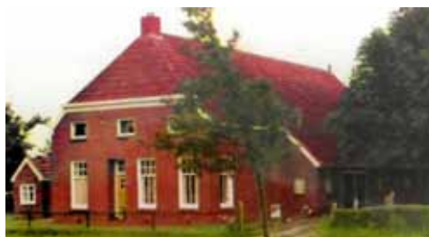
Het geboortehuis van Folkert de Boer, in Haulerwijk.