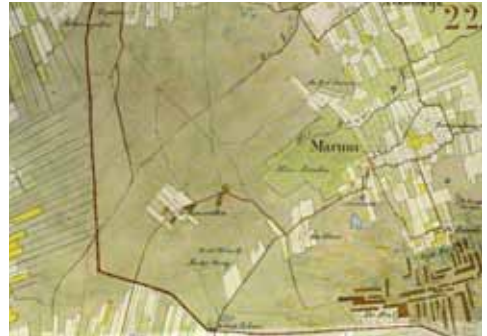
Groot Heim en Lutje Heim nabij de Blaauwe Steen, Trimunt wordt als "Driemunten" aangeduid.

Blaauwe Stenen met deze betekenis kwamen veel voor in met name Nederland, Vlaanderen, Midden Duitsland en in het Rijnland.