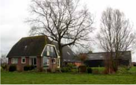
De Haarsterweg 40, de nieuwbouw van 1986

De boerderij is op dit moment 38 hectare groot (door de ruilverkaveling is alles bij elkaar gekomen) en elders gebruikt hij nog in totaal 4 hectare. In hun begintijd molken ze 40 koeien, nu zijn dat er 65, maar dit kan nog uitgebouwd worden. Het melken is inmiddels totaal veranderd door de aanschaf van een melkrobot.