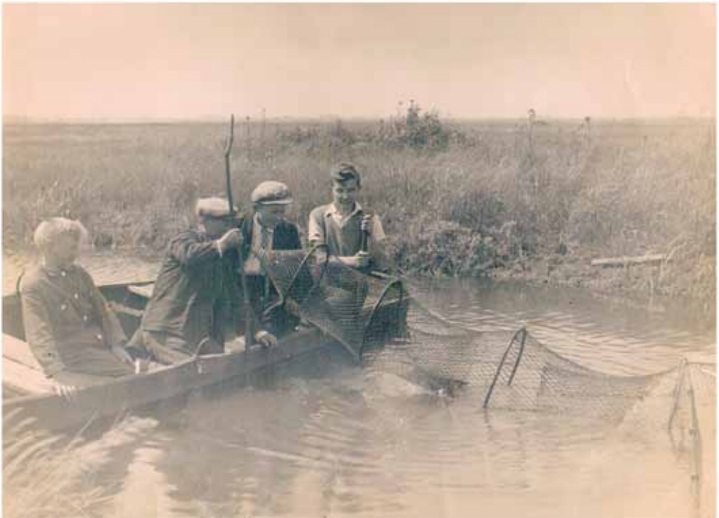
Vissen in het Oude Diep. Tweede van links met pet de schrijver. De foto is ook te zien in museum 't Rieuw tijdens de thema-expositie 2014, met als thema: In de val gelokt.

1 Staatsbosbeheer, beheerder van dit gebied, is van plan het Oude Diep weer in zijn oorspronkelijke staat terug te brengen. Dus meanderend. Er is reeds een begin gemaakt.