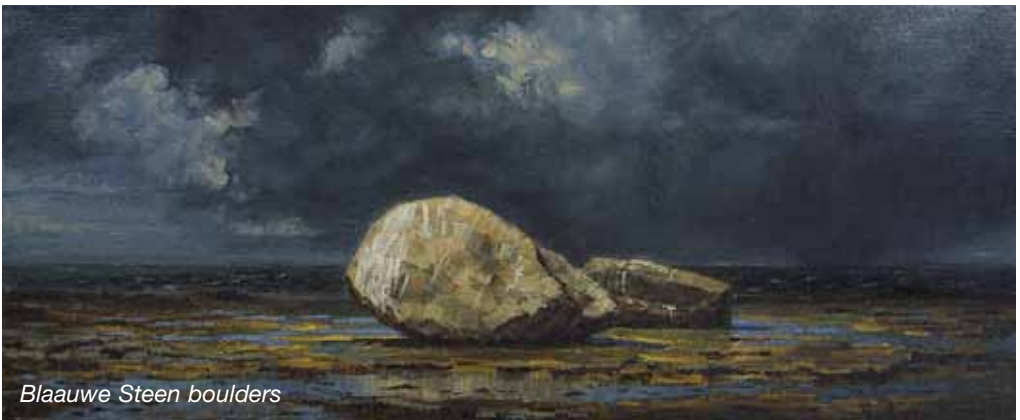
Blaauwe Steen boulders

Uiteindelijk zijn in Vredewold-West de Blaauwe Steen en de nabije galg gezamenlijk gesitueerd aan de grens én aan de doorgaande weg op De Haar vlakbij Frieschepalen, op korte afstand van het klooster Trimunt en de latere schans te Frieschepalen.