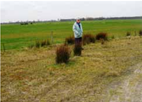
Landbouwer Geert Greydanus voor de locatie van de "Blauwe Steen"

'Hier en daar komen in het Noorden van het land thans nog blauwe stenen voor. Vele dor-