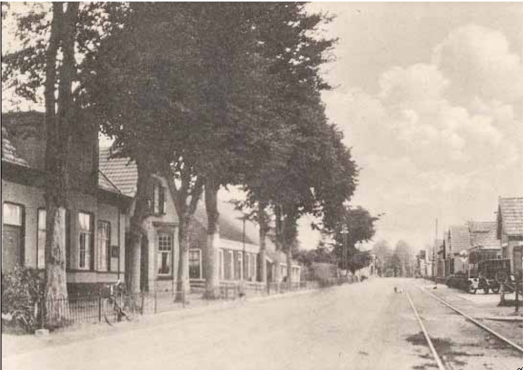
Op deze Ansichtkaart zien we uiterst links het postkantoor en rechts daarvan de boerderij Swaneneburg