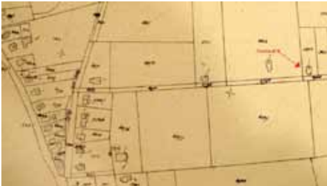
Het huis waar Ype Cupery vermoedelijk enige tijd gewoond heeft met Aaltje.

Het is heel goed mogelijk, dat Ype Cupery dit huis bouwde en hier enige tijd samen met Aaltje woonde. (zie afbeelding 2, perceel C5884, nu Houtwal 6).