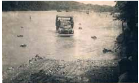
In de binnenlanden was het meestal behelpen en moest de kali vaak overgestoken worden op een ondiepe plek

En zo werden we op een gegeven ogenblik 's nachts om 2 uur gewekt door de luitenant met de mededeling "opstaan actie". En daar ging je dan met een 15-tal vrachtwagens vol Molukse en Nederlandse militairen naar een