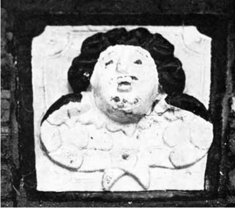
Het vrouwen- of morenkopje in de achtergevel van de boerderij Ooster-Linde.