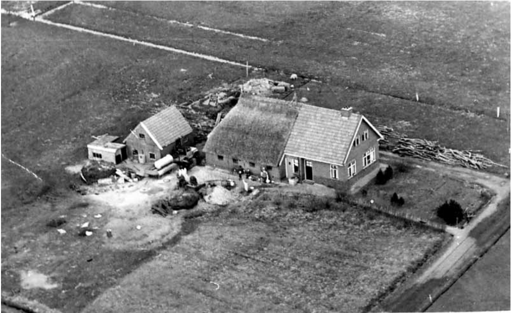
De boerderij waar de heer Terpstra in de jaren 30 woonde is nu afgebroken. Deze stond ongeveer waar nu de ingang is van Tuincentrum Ottema en de woning van de familie L. Rudolphus